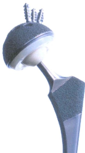
人工股関節

人工関節の対象になるのは、変形性膝関節症や関節リウマチなどで膝の関節が痛むケース。股関節の軟骨がすり減り強い痛みを感じる「変形性股関節症」の患者なども対象だ。